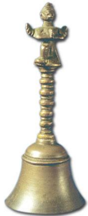
Bell found in coal from West Virginia that was dated at around 300 million years.

Disse kan i sannhet kalles «holokost fornektere» fordi de også forneker at Gud skal dømme verden nok en gang, men med ild.